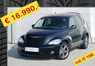
€ 16.990,- CHRYSLER PT-Cruiser Route 66 2,2 CRD, Bj. 02/07, Km 18.922 mt./€ 166,-