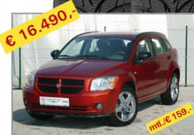
€ 16.490,- DODGE Caliber 1,8 SXT-Sport Bj. 12/06, Km 25.540, mt./€ 159,-

Aktion nur für kurze ZEIT! solange der Vorrat reicht!