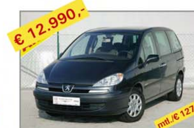
€ 12.990,- PEUGEOT 807 SR 2,0 HDI, Bj. 7/03, Km 114.626 mt./€ 127,-