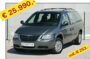
€ 25.990,- CHRYSLER Grand Voyager 2,8 CRD Business, Stow 'n Go, Bj. 08/06, Km 28.523 mt./€ 253,-