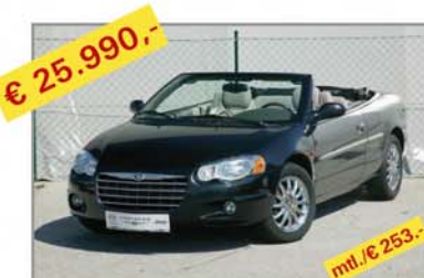
€ 25.990,- CHRYSLER Sebring Cabrio 2,7 Limtd. Automatik, Bj. 08/06, Km 20.455 mt./€ 253,-

Inklusive Jahresvignette für 2009 Gratis!