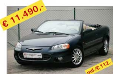
€ 11.490,- CHRYSLER Sebring Cabrio 2,7 Limtd. Automatik, Bj. 04/02, Km 73.199 mt./€ 112,-