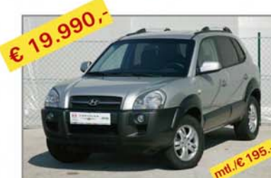
€ 19.990,- HYUNDAI Tucson 2,0 CRDi Comp+ Automatik, Bj. 08/06, Km 14.129 mt./€ 195,-