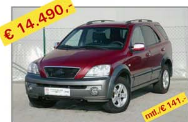
€ 14.490,- KIA Sorento 2,5 CRDi Executive Bj. 11/02, Km 157.827 mt./€ 141,-