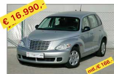
€ 16.990,- CHRYSLER PT-Cruiser, 2,2 CRD Classic, Bj. 12/06, Km 24.411 mt./€ 166,-