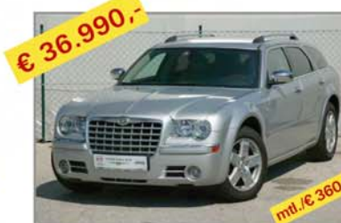
€ 36.990,- CHRYSLER 300C, 3,5 Touring AWD Bj. 11/06, Km 12.694 mt./€ 360,-