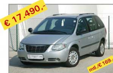
€ 17.490,- CHRYSLER Voyager 2,8 CRD New Business, Bj. 08/04, Km 84.376 mt./€ 169,-