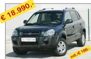
€ 18.990,- HYUNDAI Tucson, 2,0 CRDi Comp+ Bj. 07/06, Km 14.544 mt./€ 186,-