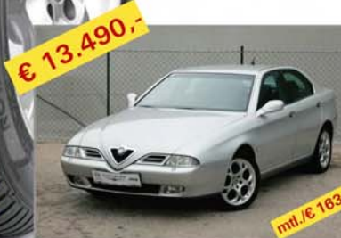
€ 13.490,- ALFA ROMEO 166 2,4 JTD Bj. 03/02, Km 94.978 mt./€ 163,-